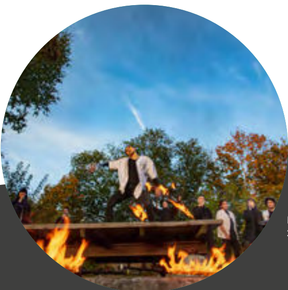
Do It Together kör och Xenos dansgrupp, Subtopias 20-årsfirande.

Upplev Botkyrka har antagit en tydlig inriktning gällande att inte vilja vara en del av problemet utan en del av lösningen och att framtiden bygger vi tillsammans. Bolaget har alla möjligheter att kunna göra skillnad och inspirera våra besökare att engagera och lära sig om Agenda 2030 och de globala målen. Vår övertygelse är även att vi blir attraktiv som bolag genom att göra detta och bedriva en hållbar verksamhet.