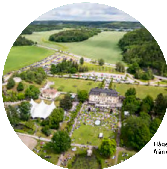
Hågelbyparken från ovan.