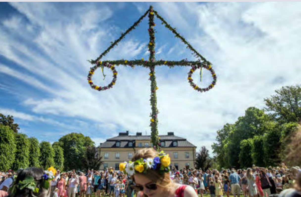
Midsommarfirande i Hågelbyparken.