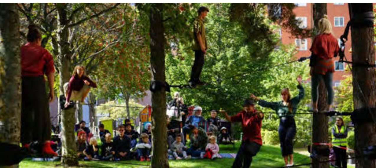
Cirkusföreställningen Naturbalans presenterad av Subtopia.