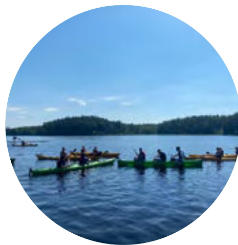
Kajakpaddling på Lida.

I all sin verksamhet ska Bolaget eftersträva en socialt, ekonomiskt och miljömässigt hållbar utveckling. Bolaget ska verka för att Botkyrka ska upplevas som en av Sveriges mest kreativa kommuner bland annat genom att möjliggöra för fler lokala kreativa och kulturella idéer samt aktörer att växa och bli långsiktigt hållbara. Dessa aktörer ska i sin tur generera arbetstillfällen och andra kulturella, kreativa och sociala värden till Botkyrkas medborgare. Bolaget ska vidare tillhandahålla kvalitativa upplevelser och infrastruktur inom kultur, natur och idrott för både kommunens medborgare och besökare utifrån.