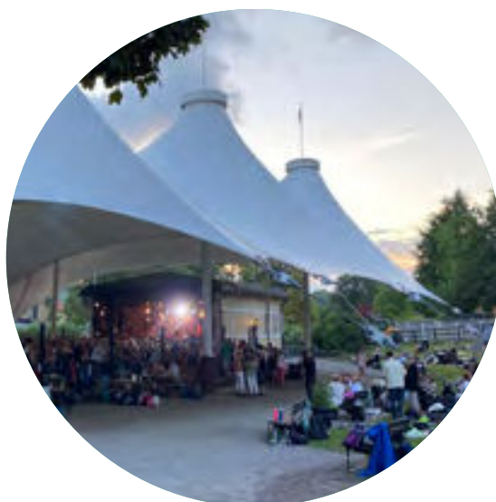
Danskväll i Hågelbyparken.